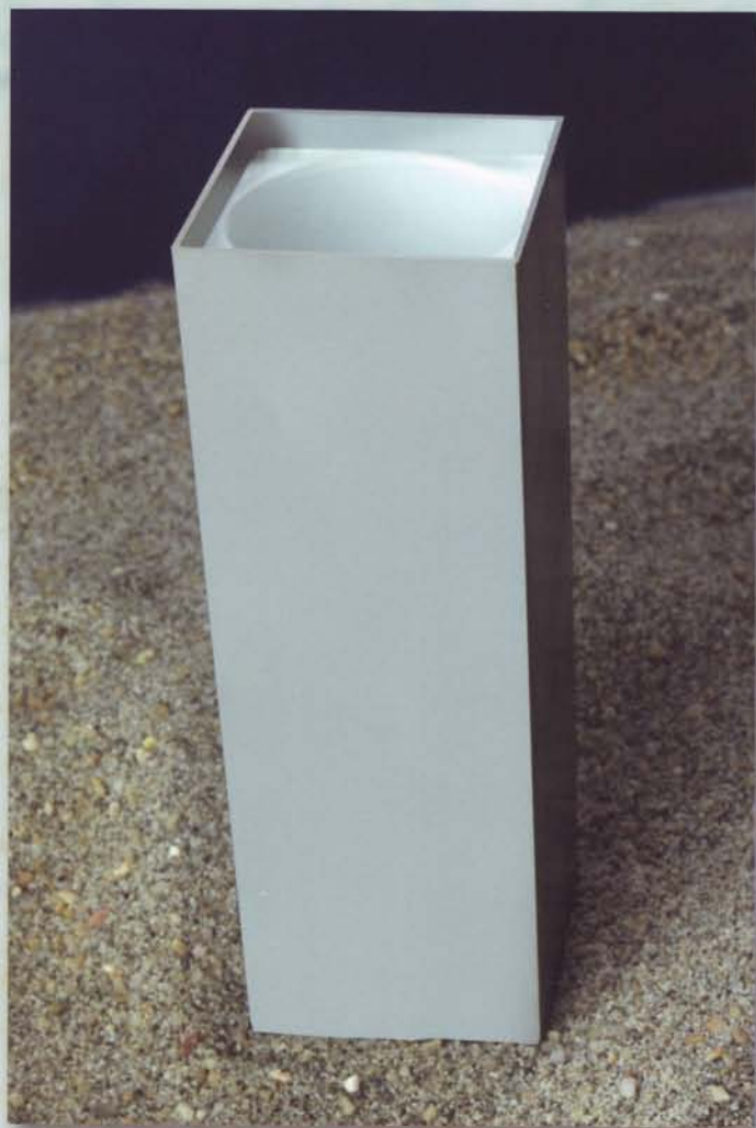
Cod. Art. 476 barattolo bordo quadro da inserire