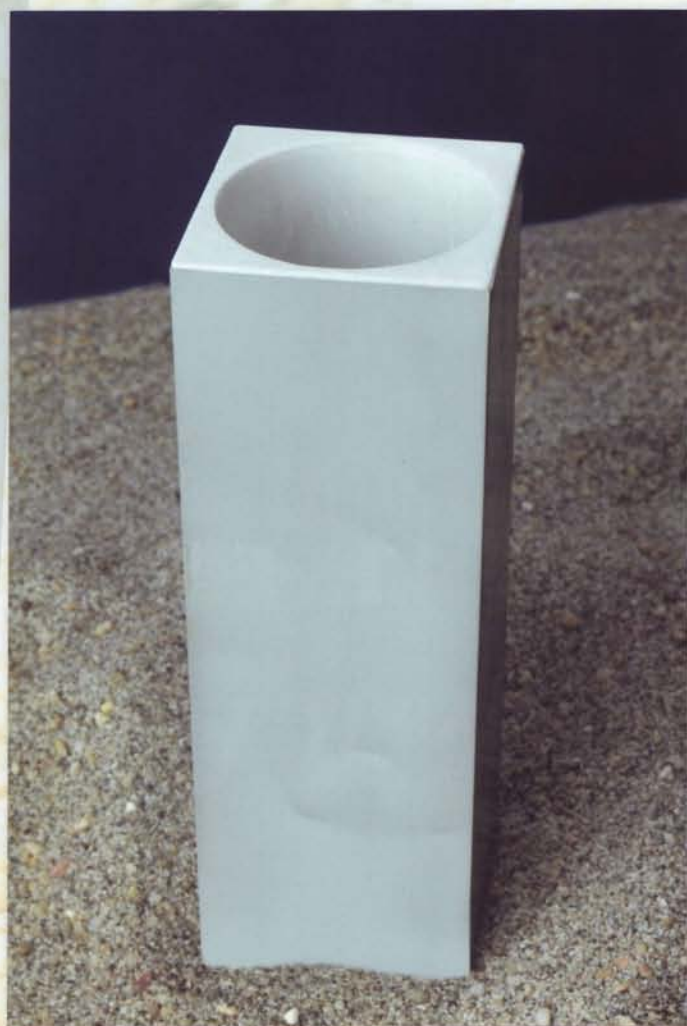
Cod. Art.475 barattolo bordo quadro da appoggio