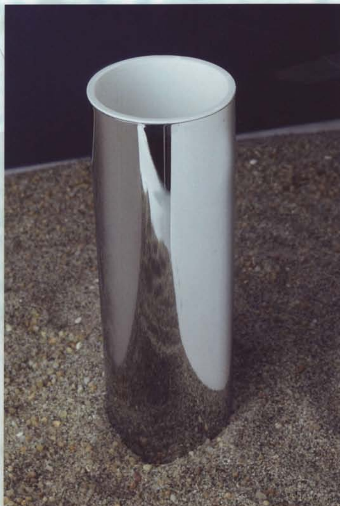
Cod. Art.474 barattolo bordo tondo da appoggio